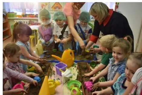
Из влажного песка можно лепить пирожки.

В текущем учебном году педагоги ДОУ усложнили задачу - чтобы экспериментирование пронизывало все сферы детской деятельности: игру, образовательные области, прогулку, чтобы весь уклад жизнедеятельности детского сада способствовал достижению новых образовательных результатов.