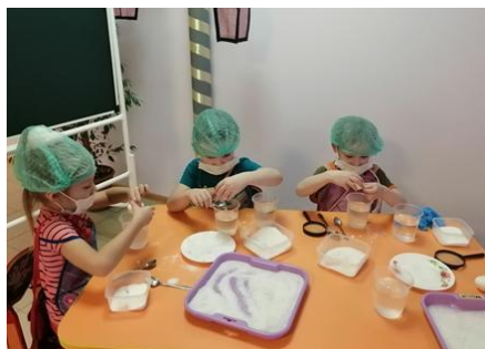
Утонет или нет яйцо, если добавим соль?