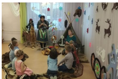
В гости к нам приходят наших предков сказки...

В декабре совместно с работниками детской библиотеки в ДООУ была проведена викторина на знание растений и животных Эвенкии, в группах проведены праздничные мероприятия. Праздник « В гости к Агияне» , проведённый в средней группе детского сада «Северок» , был представлен на районный конкурс «Лучшая практика этнокультурной направленности , посвящённый 90-летию Эвенкии.